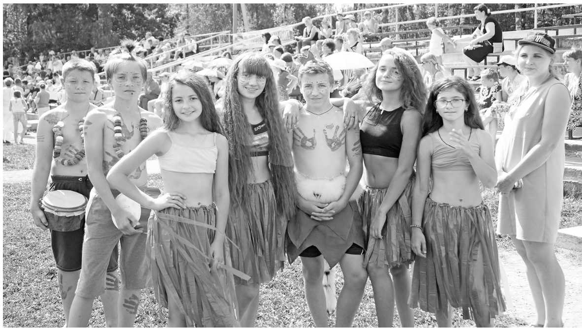
«Африканцы» - Палицкий СДК.

Особая благодарность от имени всех – главе городской администрации Геннадию Моисееву. Он позаботился о сладких призах – мороженом и, несмотря на массовость мероприятия, угощения хватало всем.